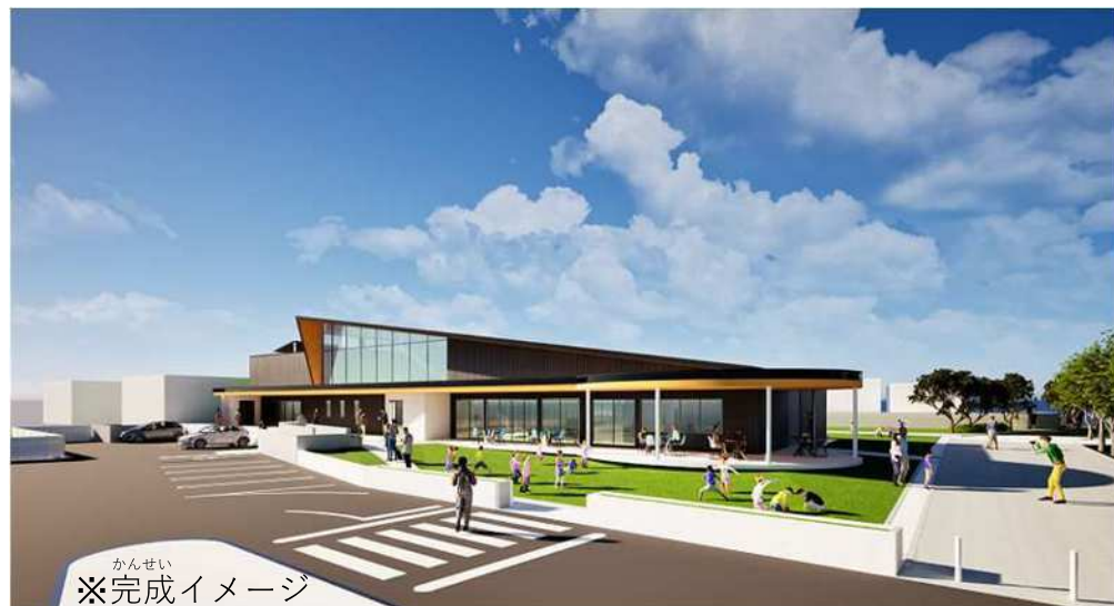
かんせい ※完成イメージ